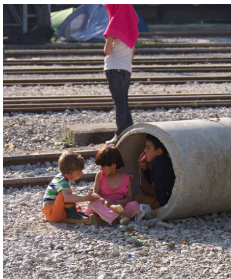
Momentaufnahme aus dem Flüchtlingscamp Idomeni an der griechisch-mazedonischen Grenze.