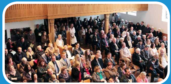
Alle sind dabei, alle machen mit