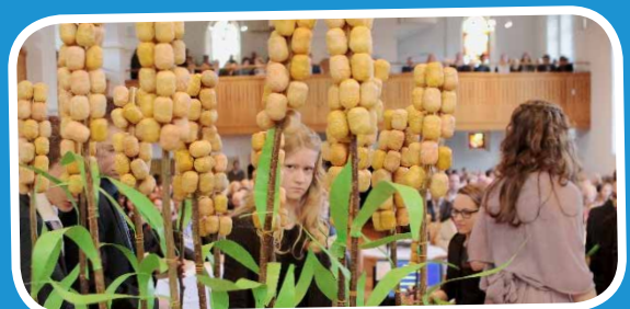
Jede/r befestigt 24 Körner in seinem Halme und fertigt so seine Ähre an