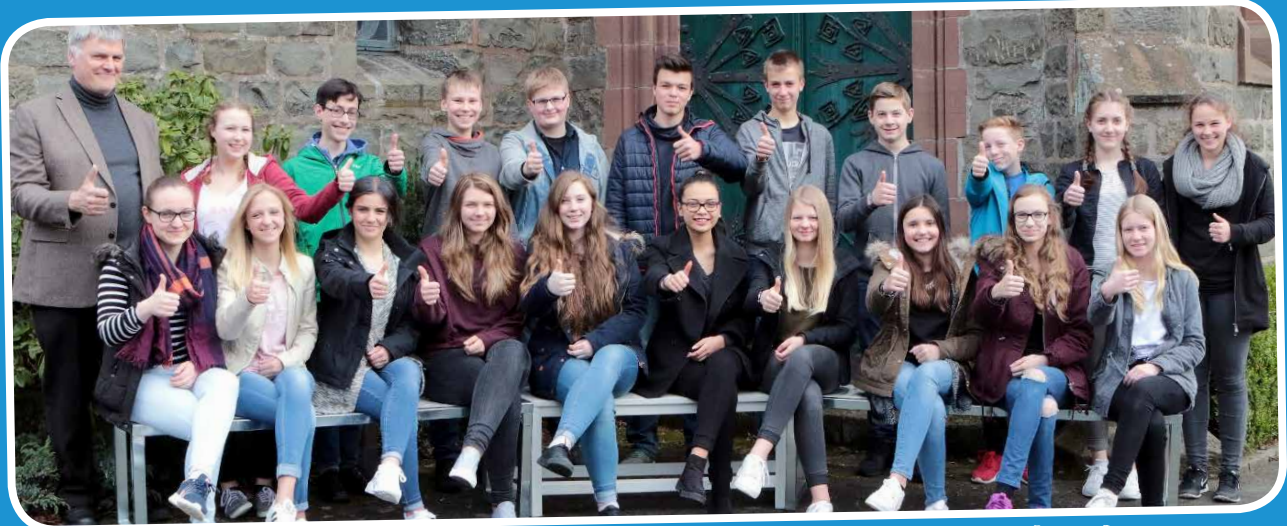
Die Konfirmandengruppe vom 24.4.2016 nach der Generalprobe