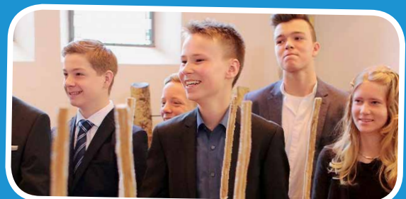
Die vorbereiteten Halme werden aufgestellt